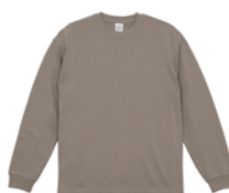
アッシュドカーキ