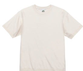
ヴィンテージホワイト