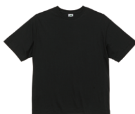
ヴィンテージブラック