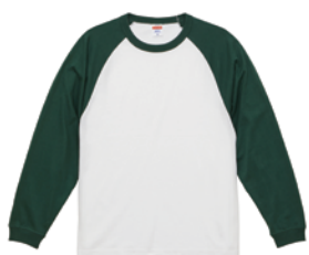
ホワイト / アイビーグリーン