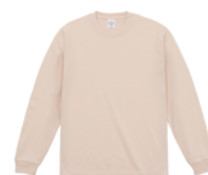
ヴィンテージナチュラル