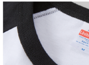
首元はバインダーネック仕様