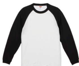
ホワイト / ブラック