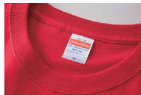
首リブは丈夫なダブルステッチ仕様