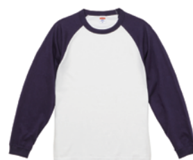
ホワイト / ネイビー