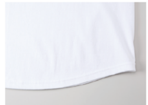
ラウンドテール仕様