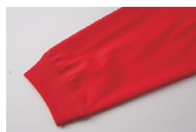
袖口は1.6インチ幅のリブ仕様、 シームラインはまたぎ2本針始末

【素材】 綿 100% ミックスグレー：綿 90%、ポリエステル 10% アッシュ：綿 98%、ポリエステル 2% ※袖口はリブ仕様