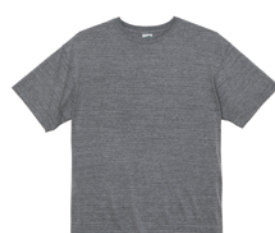
ヴィンテージフェザー