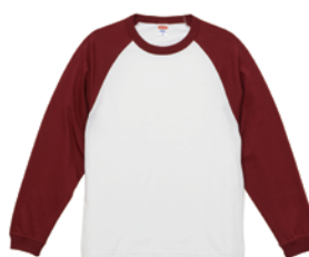
ホワイト / バーガンディ